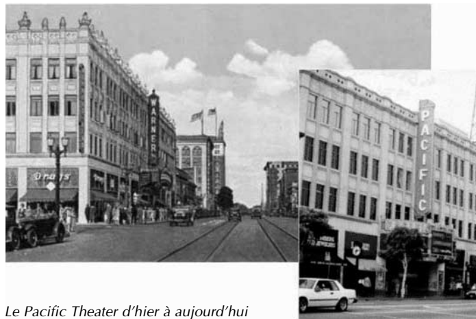
Le Pacific Theater d'hier à aujourd'hui