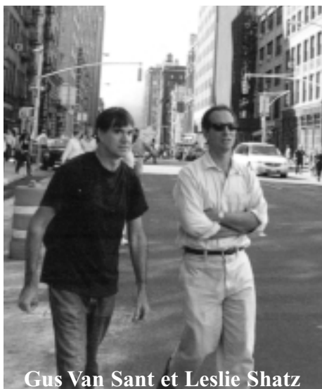
Gus Van Sant et Leslie Shatz

G us Van Sant est l'un des réalisateurs américains contemporains les plus courageux. Il n'est pas du genre à faire des choix conventionnels sous la pression de l'extérieur ; il repense et réévalue chaque étape de la fabrication d'un film. A une époque où le cinéma numérique a le vent en poupe, Gus a choisi de faire Elephant , dernier de ses exploits, en utilisant une caméra 35 mm montée sur une dolly traditionnelle, nécessitant la pose de plusieurs dizaines de rails de travelling, plutôt que de faire appel à une steadycam. De plus Elephant a été filmé en 1/33, format depuis longtemps délaissé par la plupart des cinéastes du monde entier. Il a ensuite été monté en 35 mm sur une table de montage Kem, qui apparaît aujourd'hui comme une machine désuète, vestige du siècle dernier.