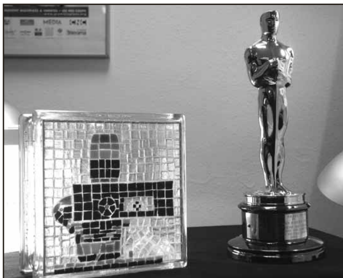
Côte à côte à la CST : Vulcain et Oscar