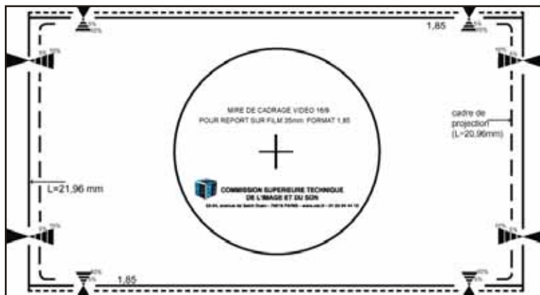
La mire de cadrage 16/9

Editions CST (Julia Dubourg, Technicienne vidéo)