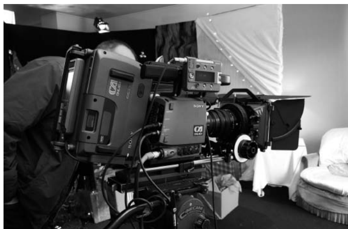
La caméra Sony F23

Le 14 janvier 2008, « jour de galette », la CST a accueilli à l'Espace Pierre Cardin la présentation de la nouvelle caméra Sony F23. Plus de trois cents personnes étaient au rendez-vous !