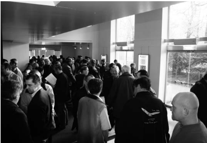
Une assistance fournie

Après le succès de la première Journée des Techniques de l'Exploitation en avril 2007, la CST a décidé de rendre pérenne ce rendez-vous concernant l'évolution des technologies de la diffusion du film.