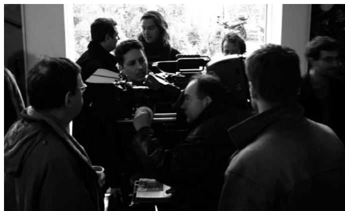
Chacun son tour !