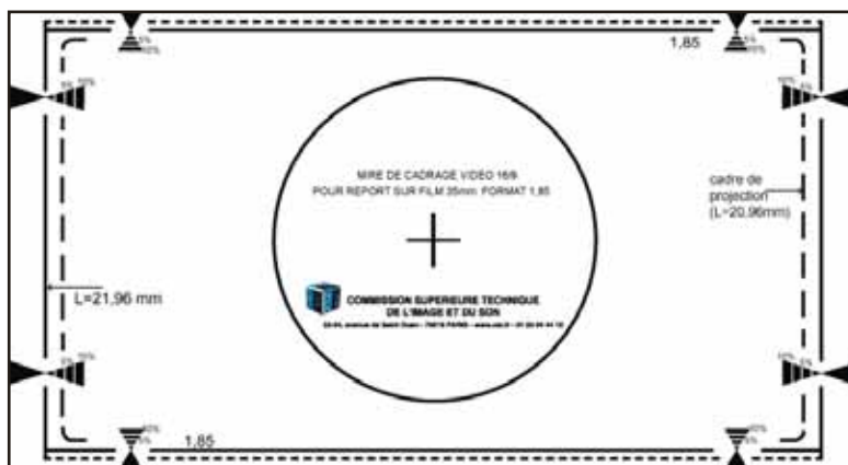
La mire de cadrage 16/9

Editions CST (Julia Dubourg, Technicienne vidéo)